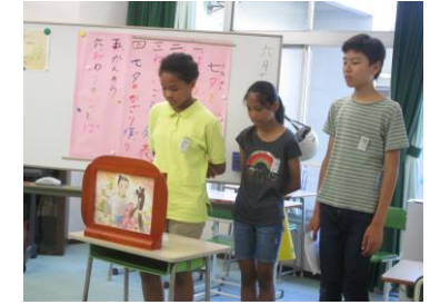
七夕の紙芝居 「おりひめとひこぼし」