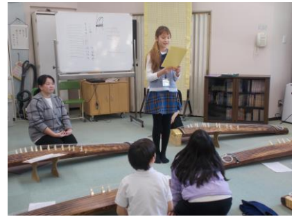
▲終わりの言葉の5年生です。