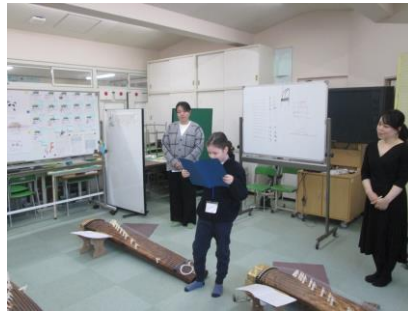
▲最初の言葉の3年生です。