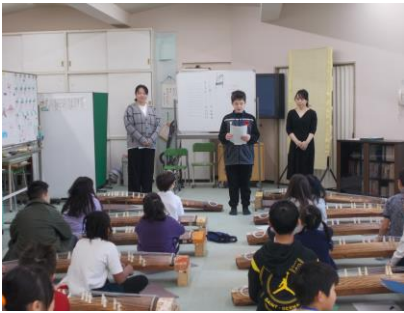
▲5年生が司会をしました。

1月のグループ活動「箏に親しもう」で、「日本伝統文化の会」の先生方に来ていただき、箏の演奏を聞かせていただきました。音に合わせて体を揺らしながら、すてきな音色を味わいました。その後、演奏の仕方を教えていただいて、「さくらさくら」の曲を演奏しました。箏の楽譜は数字で書かれています。楽譜の数字と合うように弦を数えたり、音を出して確かめたりしながら練習していました。弦を弾いたときの音や、メロディーを奏でることの楽しさを味わい、たくさんの子が「楽しかったです。」「また、来年もやりたいです。」と、お礼のお手紙に書いていました。