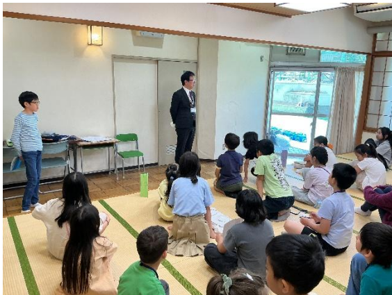
▲校長先生のお話をしっかり聞きました。

これから毎月グループ活動を行っていきます。子どもたちが日本の文化に触れたり、大勢の前で発表をしたりするよい機会になるように努めてまいります。毎月のグループ活動の様子を日本語学級便りで紹介していきます。