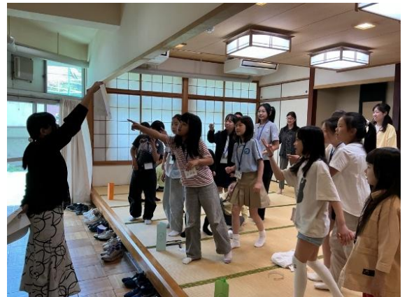
▲文字の数を数えて、グループを作りました。