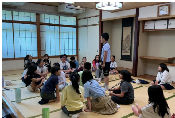
▲自己紹介をしました。学年、名前、好きなものを伝えました。