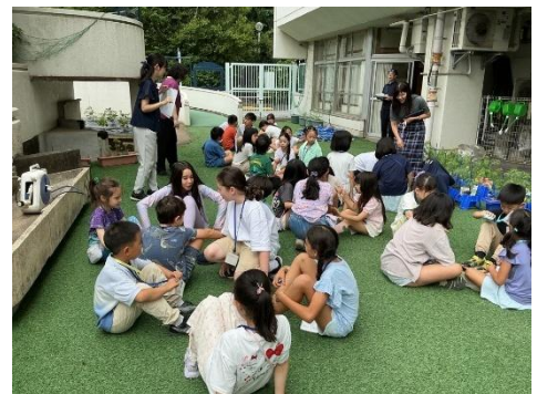
▲文字の数を数えて、グループを作りました。