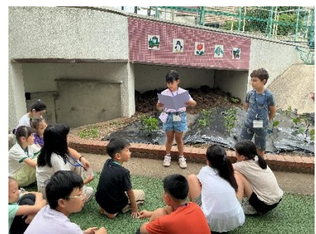
▲2年生が終わりの言葉を言いました。