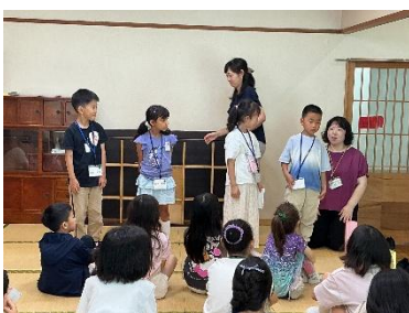
▲1年生が自己紹介をしました。