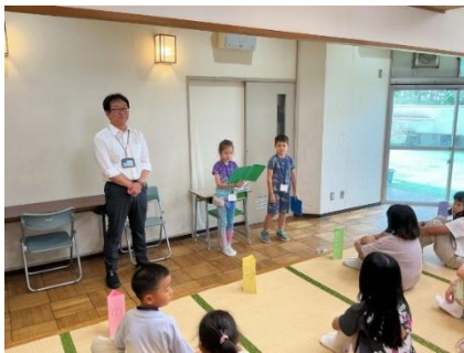
▲2年生が、司会と始めの言葉を担当しました。

日本語学級では個別や少人数で学習することが多いので、普段は顔を合わせる機会が少ない人もいますが、日本語学級にはたくさんの仲間がいます。学校生活で困ったことがあったら、お兄さんやお姉さんたちに相談したり、お互いに助け合ったりしてほしいと思います。