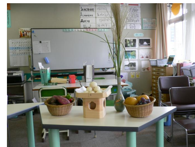
Departement de l'école primaire de Kogai

Adresse: Nishi-azabu 3-11-16, Minato-ku, Tokyo